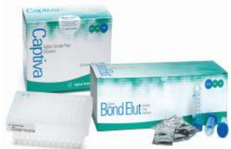
Produkty pro přípravu vzorků (SPE, QuEChERS, filtrace)